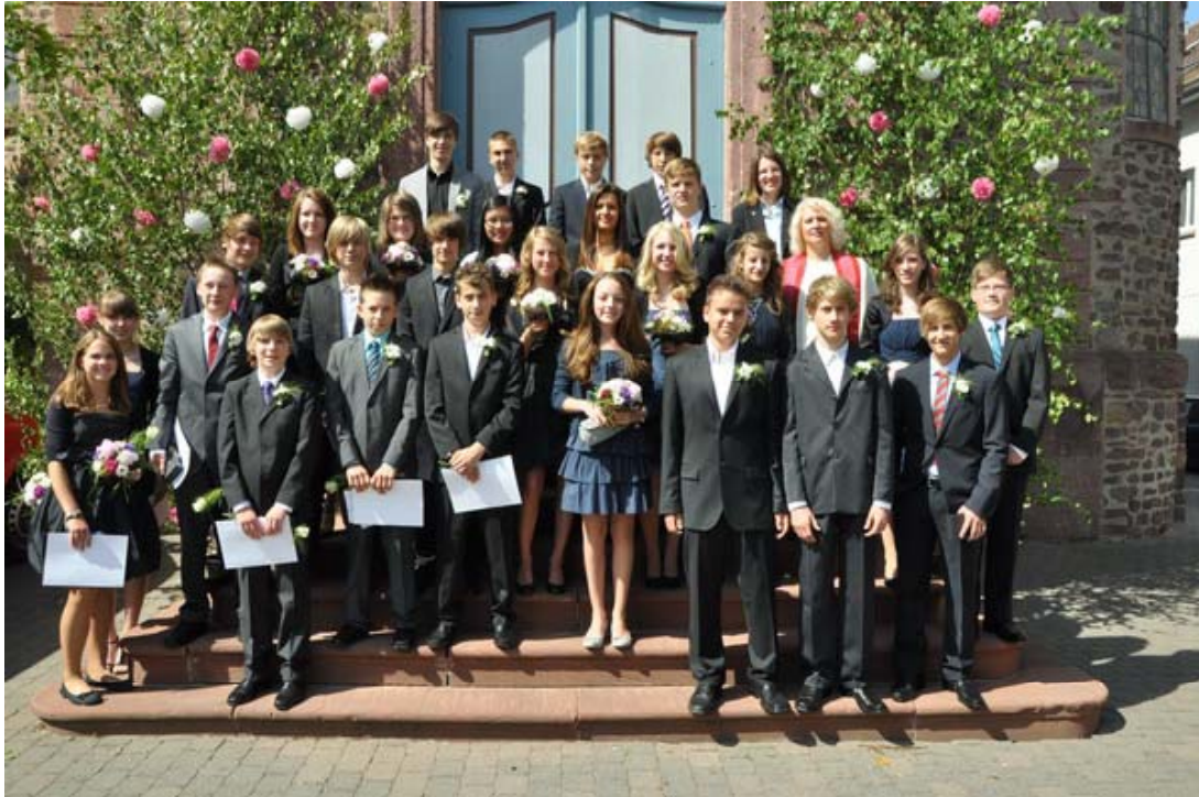
Die diesjährigen Konfirmandinnen und Konfirmanden...