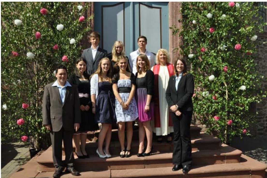
...und ihre Betreuerinnen und Betreuer