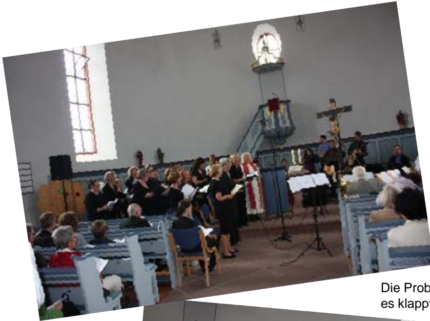
Die Proben hatten sich gelohnt; es klappte alles wie am Schnürchen!