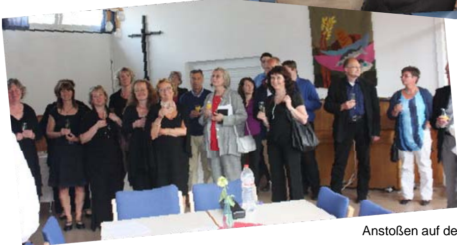
Anstoßen auf den gelungenen Gottesdienst