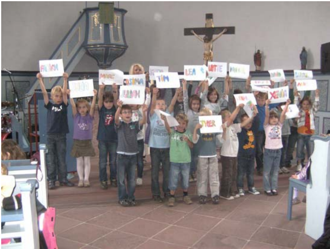
Die zukünftigen Schulkinder unserer KITA wurden im Gottesdienst am 21. Juni verabschiedet.