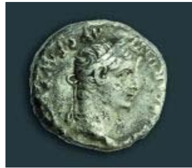
Ein Silberdinar aus der Zeit um 14 n. Chr. (Vorderseite)

Fazit: Das neue Bibelhaus-Erlebnismuseums ist auf jeden Fall einen Besuch wert.