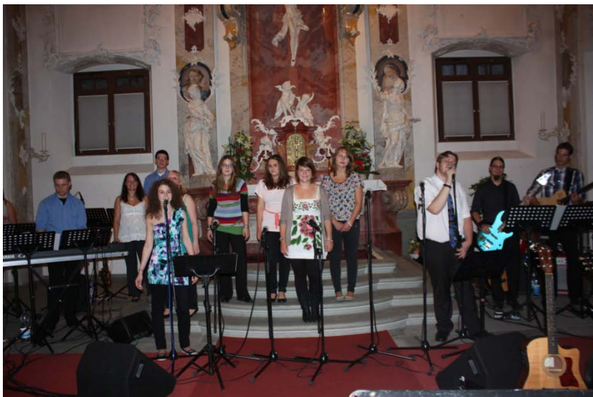
„Colours of Life“ in der Schlosskirche Meersburg

Life“ im ersten Halbjahr erarbeitet und in einer Probenwoche vor dem Konzert verfeinert. Direkt nach der Ankunft am Freitagabend wurde die Anlage aufgebaut und am Samstag jeder einzelne Song auf die tolle Akustik der Barockkirche abgestimmt. Statt des angekündigten Regens schien die Sonne und lockte während des Einspielens viele Touristen in die Kirche, die die Kombination von Barockengel, Stuck und rockiger Musik schmunzelnd und fasziniert zur Kenntnis nahmen. Mit 27 Titeln, drei Zugaben, Standing Ovations nach zwei Stunden Konzert und einer insgesamt berausenden Atmosphäre gehört dieses Konzert zu den Spitzenerlebnissen von „Colours of Life“.