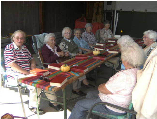
Die Ev. Frauenhilfe Götzenhain