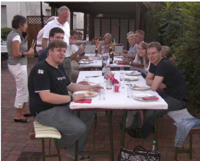
Geschenk zur Verleihung des Kulturpreises der Stadt Dreieich: Grillabend des Kirchenvorstandes mit der Band „Colours of Life“ im Kirchgarten am 20. August