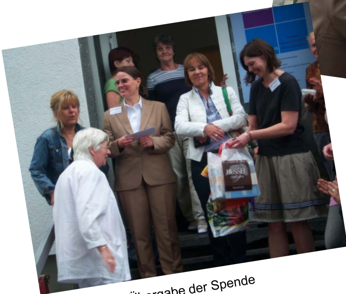
Übergabe der Spende