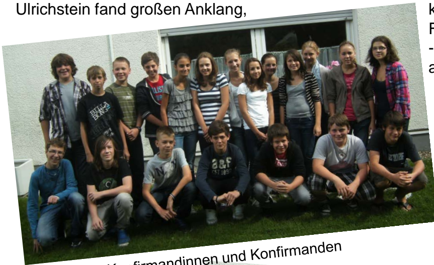
Konfirmandinnen und Konfirmanden

Die zahlreichen Konfimitarbeiterinnen und -mitarbeiter unterstützten die Pfarrerin durch ihr Engagement, so dass auch ein Armbruch der Stimmung keinen Abbruch tat. Die Fahrt hat allen gut gefallen - und wir freuen uns schon auf die nächste!