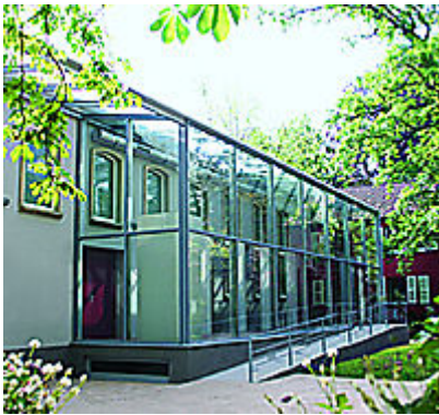
Außenansicht des neuen Bibelhauses mit Glasfoyer

Die Gruppe war am Nachmittag mit öffentlichen Verkehrsmitteln zu einer Führung durchs Bibelhaus Erlebnismuseum aufgebrochen.