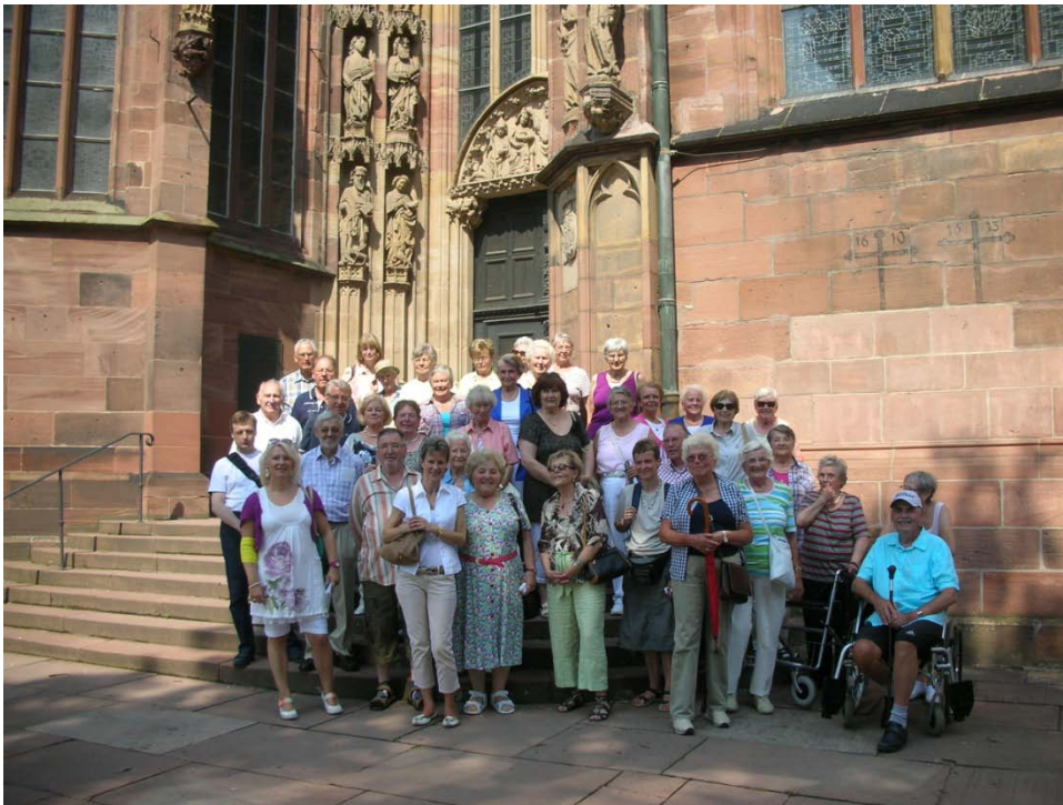
Vor dem Wormser Dom

unter den Nationalsozialisten zerstört worden war. Mit ihr ging auch die große jüdische Gemeinde verloren, die dort vor der Martinspforte in ihrem Ghetto lebte. Der bis heute berühmte Rabbiner Raschi - ursprünglich aus Nordfrankreich stammend - hatte dort seine bis heute gültigen Auslegungen zur Thora (den 5 Büchern Mose) verfasst. Natürlich mussten unsere männlichen Besucher eine sogenannte Kippa aufziehen, ein kleines Käppchen, das die Besucher beim Betreten einer Synagoge tragen müssen.