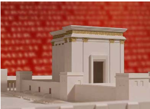
Modell des Herodianischen Tempels (Jerusalem) Im Bibelhaus Frankfurt